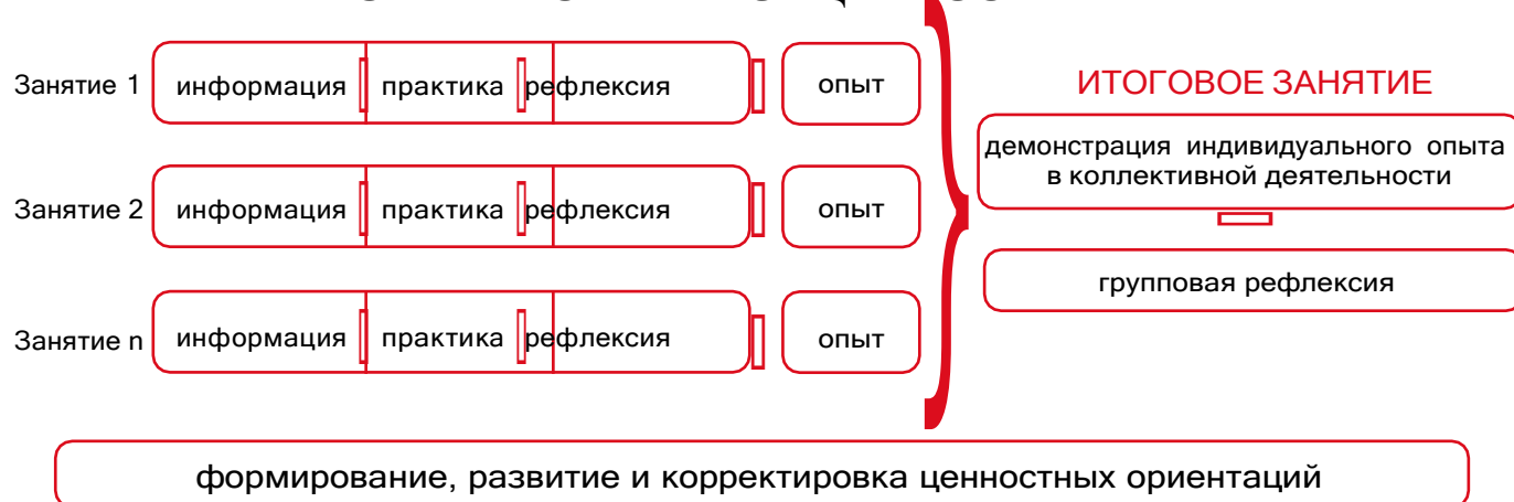
Рисунок 1 — Схема организации события

Таким образом, у пятиклассников происходит построение логической цепочки от собственного опыта проживания каждого занятия к ознакомлению с опытом других детей и к формированию общего отношения классного коллектива к прожитому ими событию.